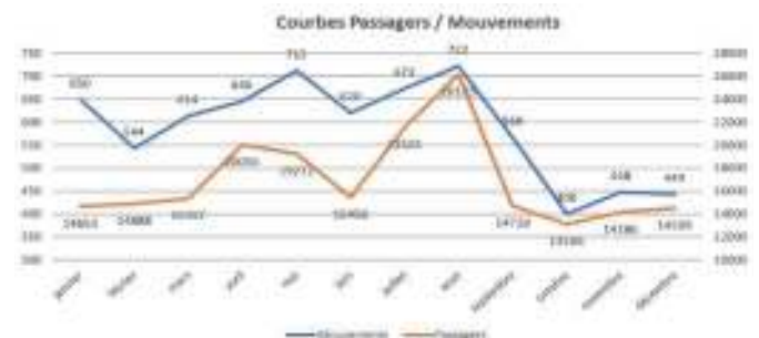
Fig. 3.1 : Trafic aérien : passagers et mouvements

Coté trafic de marchandises, le nombre de mouvements de conteneurs EVP a augmenté de 9% entre le quatrième trimestre 2023 et le même trimestre en 2023.