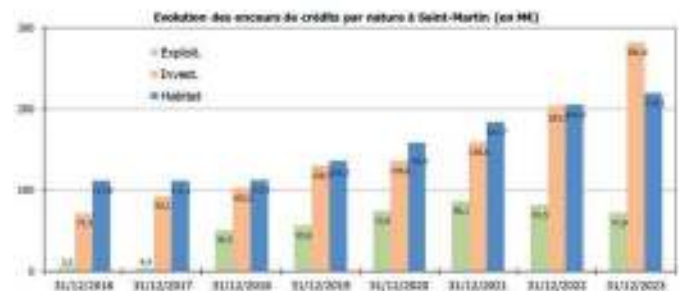
Fig. 2 : Encours de crédits

Les crédits d'investissement sont particulièrement dynamiques (+38% sur un an) et contribuent majoritairement à la croissance totale de l'encours, suivis par les crédits immobiliers (+7%). A contrario, les crédits d'exploitation reculent (-12%), après le "boom" des PGE en 2020/2021. Les crédits aux entreprises sont composés pour l'essentiel de crédits d'investissement et à l'habitat.