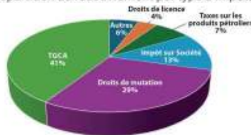
Fig. 5 : Répartition des recettes fiscales