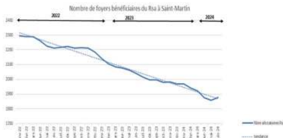
Fig. 3 : Foyers bénéficiaires du RSA

8,2% des bénéficiaires du Rsa perçoit simultanément la prime d'activité (Ppa). Ils sont 12% en Guadeloupe.