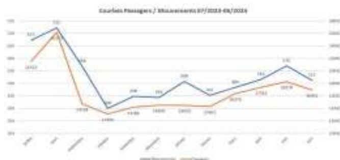
Fig. 2.1 : Trafic aérien : passagers et mouvements Source : EDEIS/Aéroport Grand Case

Dans le même temps, le nombre d'escales maritimes a fortement progressé par rapport à l'année dernière : +30% (Fig.2.2).