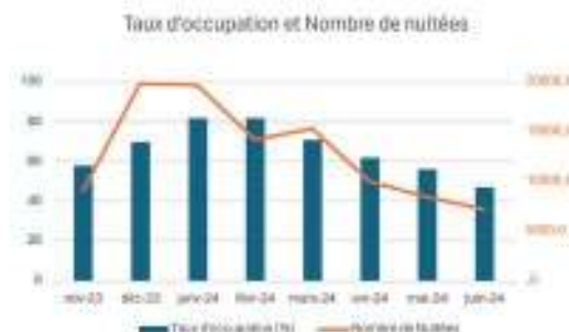
Fig. 4 : Taux d'occupation et nombre de nuitées dans les hébergements collectifs de Saint-Martin

On constate un recul de cette fréquentation dès le mois de février avec un taux d'occupation de 71% et une baisse de plus de 5000 nuitées. Une baisse notable de l'activité touristique à partir du mois d'avril marque le début de la basse saison. Le recul est particulièrement marqué à partir du mois de mai. (Fig.4)